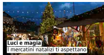
Luci e magia I mercatini natalizi ti aspettano

Ranking: 20 case in vendita con prezzi trattabili