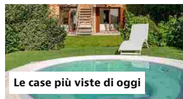
Le case più viste di oggi

Case vacanze: Mercatini di Natale 2024 in Italia: i più suggestivi e originali