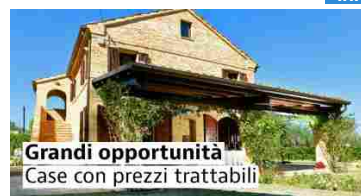
Grandi opportunità Case con prezzi trattabili