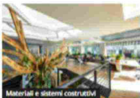
Materiali e sistemi costruttivi

Edileco arriva a Milano con il primo ufficio certificato Biophilic Design d'Italia: "The Forest"